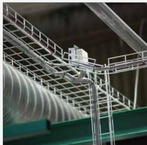
Oavsett hur du behöver dra dina kabelstegar så kan vi ta fram ett specialanpassat kit för just för dig.

För dig som hellre vill klippa själv kan jag rekommendera vår Träcklippmaskin X77. Det är den bästa på marknaden!