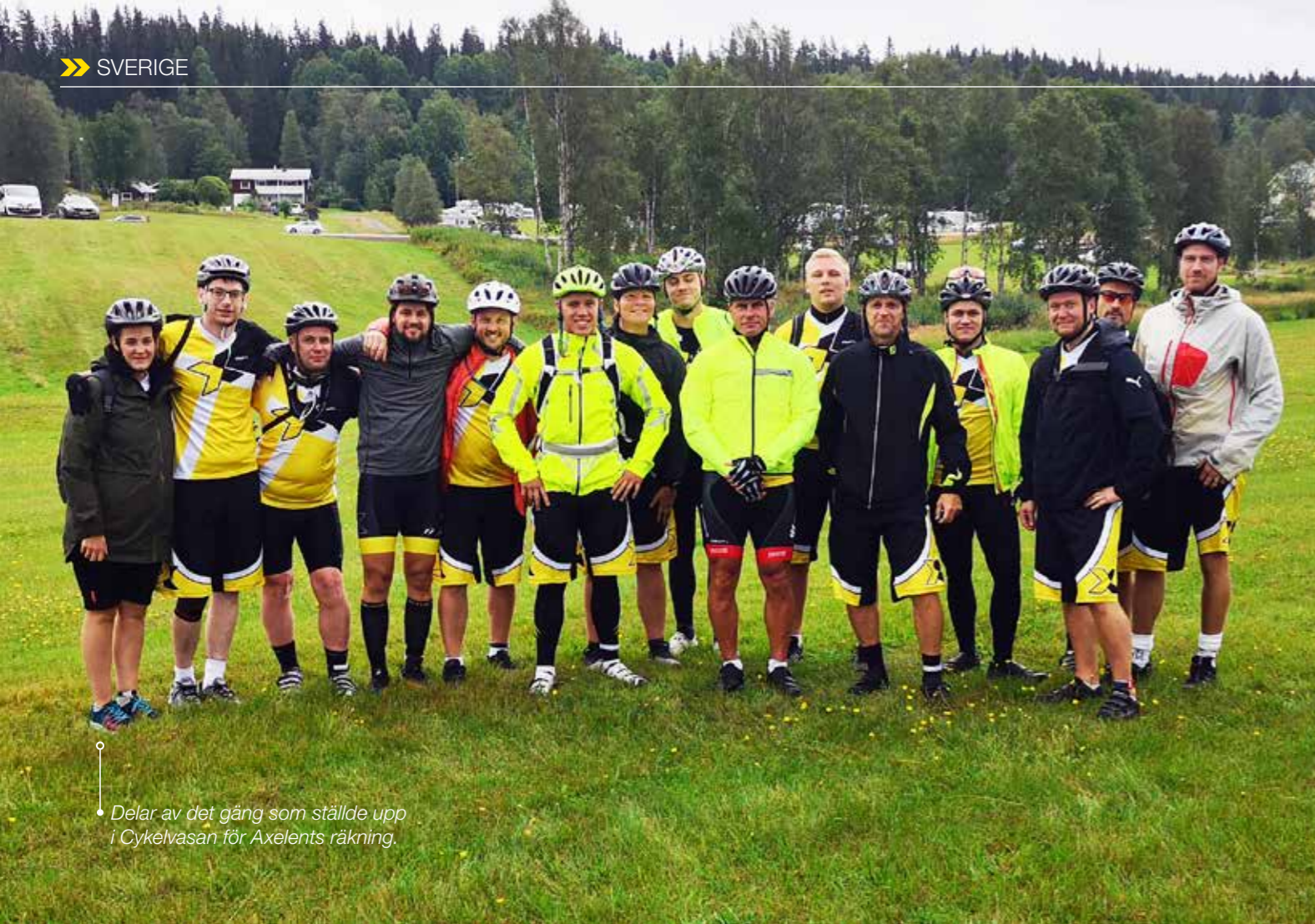
Delar av det gäng som ställde upp i Cykelvasan för Axelents räkning.