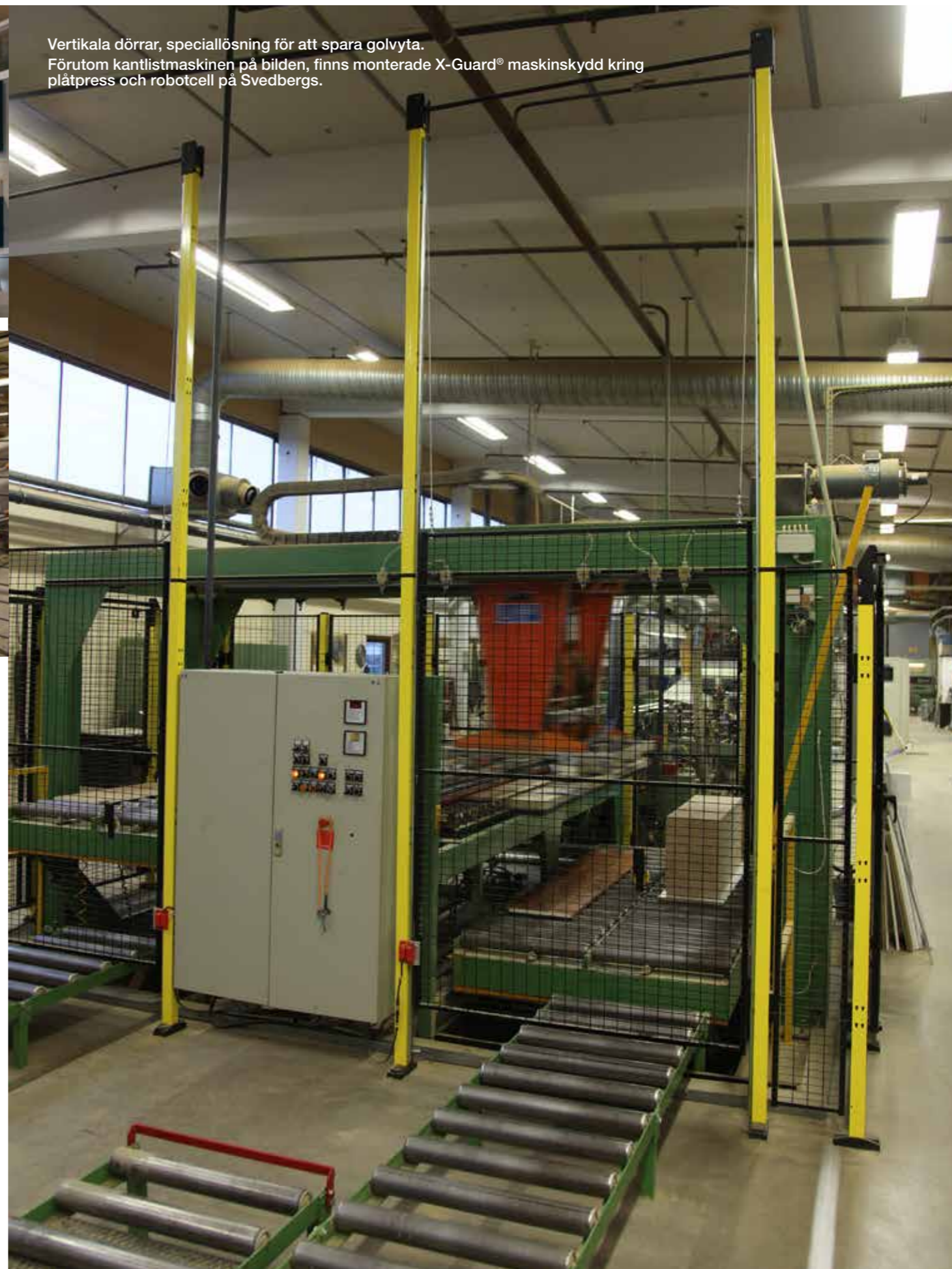
Vertikala dörrar, speciallösning för att spara golvyta. Förutom kantlistmaskinen på bilden, finns monterade X-Guard® maskinskydd kring plåtpress och robotcell på Svedbergs.

Det är svårt att tro idag, men på 1960-talet saknade en tredjedel av bostäderna i Sverige badrum. I pyttelilla orten Dalstorp, Västergötland, förändrade företaget Svedbergs synen på hur ett badrum skulle se ut, genom att kombinera badrumsspeglarna med ett skåp vilket ingen gjort tidigare. Under årens lopp utvecklades sortimentet av badrumsskåp i både metall och trä och idag är Svedbergs Nordens ledande leverantör av badrumsprodukter.